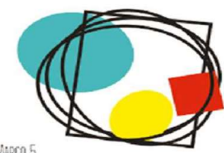
LÍNEA MARCO 5. ESTRATEGIAS PARA LA MEJORA DE LA CONVIVENCIA, LA INCLUSION Y LA IGUALDAD.

La formación dotará al profesorado de las herramientas necesarias para desarrollar un modelo de enseñanza que favorezca el pensamiento crítico, creativo y transformador en el alumnado; y que lo empodere para tomar decisiones conscientes y actuar responsablemente frente a los retos y desafíos que plantean los ODS. La educación, a través de la innovación, la creatividad, la equidad y la evaluación es imprescindible para alcanzar los ODS.