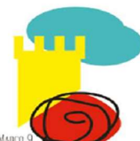
LÍNEA MARCO 9. ESTRATEGIAS PARA EL CONOCIMIENTO DEL ENTORNO CULTURAL Y NATURAL.

Esta línea busca una mejora de los centros educativos ya que desempeñan un papel activo a la hora de proporcionar y garantizar el bienestar social, físico y emocional del alumnado y del profesorado. Para ello se realizarán formaciones sobre espacios; educación socioemocional; salud, prevención, riesgos y hábitos saludables; desarrollo personal, bienestar subjetivo y ajuste social.