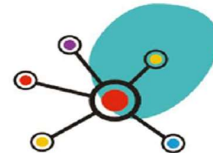
LÍNEA MARCO 3. ESTRATEGIAS PARA LA MEJORA DE LA COMPETENCIA DIGITAL EDUCATIVA.

Esta línea pretende promover la observación, el autoanálisis, la innovación e investigación, la difusión, el intercambio de experiencias educativas y la organización y gestión escolar de éxito, para mejorar la convivencia y seguir caminando hacia la absoluta inclusión e igualdad. Para conseguirlo, la formación del profesorado se orientará a: gestión de centros y liderazgo educativo, proyecto STEAM, diseño, acompañamiento y evaluación de Planes, Proyectos y Programas de Innovación Educativa y desarrollo de los equipos impulsores.