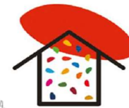
LÍNEA MARCO 4. ESTRATEGIAS PARA LA INCORPORACION DE LOS OBJETIVOS DE DESARROLLO SOSTENIBLE EN EL AULA Y EN LOS CENTROS EDUCATIVOS.

La digitalización cambia la experiencia educativa de toda la sociedad por lo que el profesorado debe saber evolucionar y adaptarse. Se buscará garantizar los derechos educativos de todo el alumnado y profesorado mitigando la brecha digital (tanto en el acceso como en el uso) y procurando asegurar que la tecnología llegue a la mayor parte de la población. Para ello se impulsará la competencia digital e informacional de la comunidad educativa y la creación, utilización y difusión de recursos educativos abiertos.