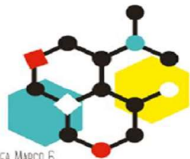
LÍNEA MARCO 6. ESTRATEGIAS PARA LA CREACION Y CONSOLIDACION DE LA ESTRUCTURA DE REDES DE COLABORACION COMO ESTRATEGIA BÁSICA DE ORGANIZACION EDUCATIVA.

Esta línea propone un modelo de formación que contribuirá a la creación de alianzas entre todos los miembros de la comunidad educativa que posibilite el abordaje eficaz de situaciones complejas en los diferentes contextos educativos. Además, promoverá la internacionalización y los proyectos europeos que ofrecen oportunidades de estudio, formación, experiencia laboral o voluntariado y cooperación en el extranjero.