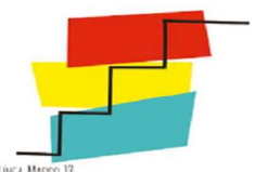
LÍNEA MARCO 12. ESTRATEGIAS PARA EL DESARROLLO Y MEJORA DE LA FORMACION INICIAL Y EL APRENDIZAJE PERMANENTE.

La formación del profesorado acercará la realidad de nuestros entornos culturales, sociales y naturales a toda la comunidad educativa. El profesorado, desarrollando el espíritu crítico del alumnado, creará vínculos entre este y su entorno. Para lograrlo se potenciarán las formaciones que fomenten la conciencia cultural y natural y el respeto por las lenguas propias.