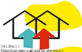
LÍNEA MARCO 1. ESTRATEGIAS PARA LA MEJORA DEL APRENDIZAJE.

Si queremos que el alumnado adquiera estrategias para resolver los problemas reales, desarrolle competencias, habilidades y formación en valores, debemos utilizar metodologías y estructuras organizativas que procuren una nueva forma de aprender: la escuela abierta y participativa, la formación a la comunidad educativa, la actualización científica y curricular del profesorado, la profundización metodológica, el trabajo sobre evidencias científicas, la adquisición de competencias comunicativas en diferentes lenguas y la evaluación del aprendizaje.